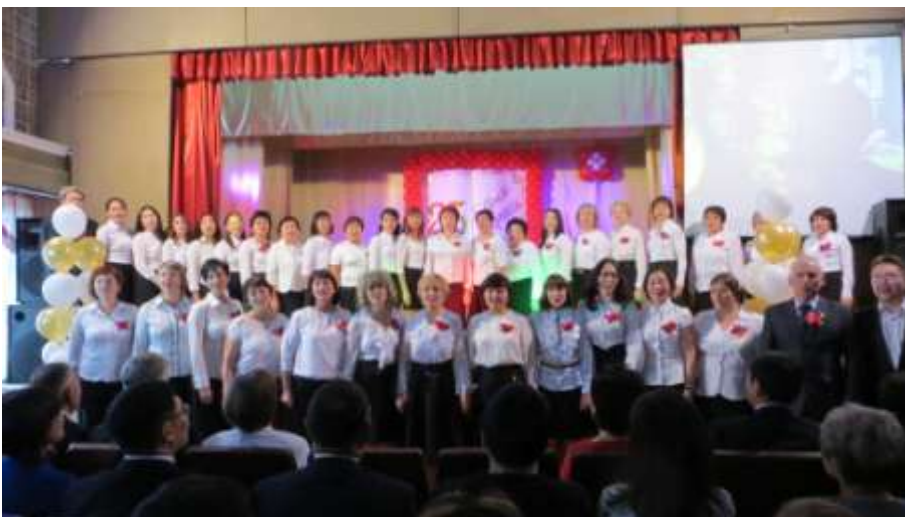
Педагогический коллектив МАОУ СОШ №26.

Школа -пилотная площадка по развитию РДШ