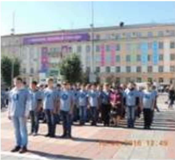
Команда школы на 1 региональном слете РДШ, сентябрь 2016г

Школа -пилотная площадка по развитию РДШ