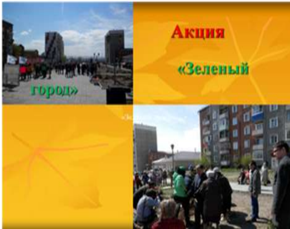
Уборка сквера им.П.Ф.Сенчихина