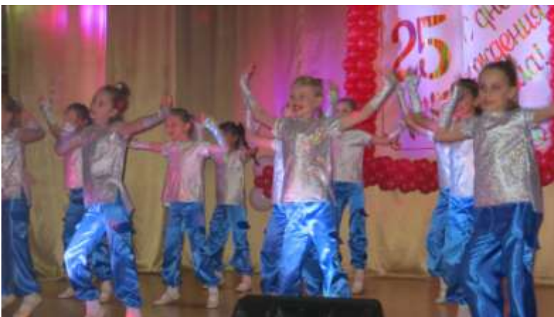
Дополнительное образование .Хореографическая группа «Фантазия»