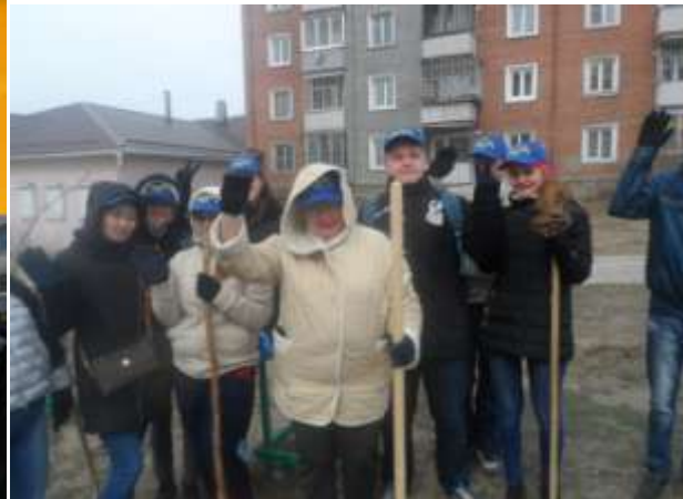
Добровольцы 11а класса